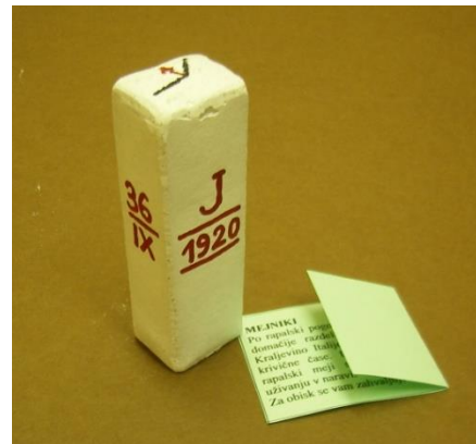
Izdelava miniaturnega mejnika