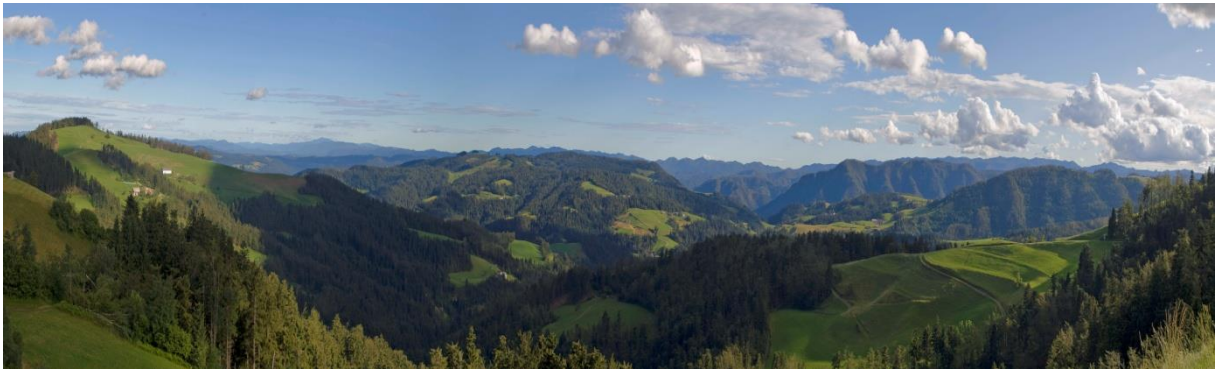
Pogled z bližine planinske koč, od glavnega mejnika rapalske meje, št. 35