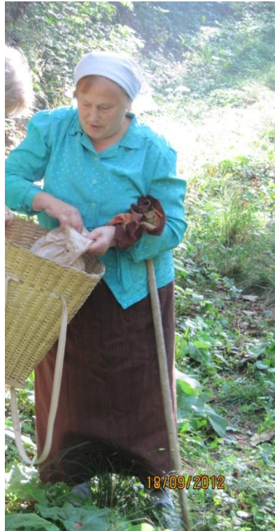
Iz igranega prizora o kontrabantu (fotografija je iz arhiva šole Sovodenj)

»Kmalu bo 100 let, ko so ljudje v naših krajih začeli kontrabantati, na skrivaj nositi dobrine čez mejo, da so zaslužili. Ena takih je bila tudi Mica, ki jo opisuje zgodovinar profesor Tomaž Pavšič.« (igrata Mica in domačinka)